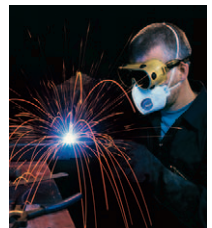
Bau- und Nebengewerbe