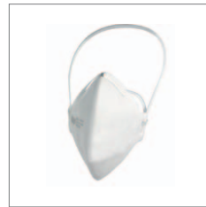
Dräger X-plore 1730