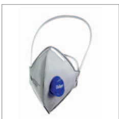
Dräger X-plore 1710 V Odour