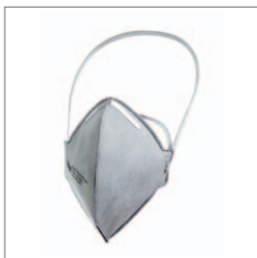
Dräger X-plore 1710 Odour