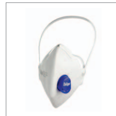
Dräger X-plore 1730 V