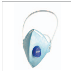
Dräger X-plore 1720 V