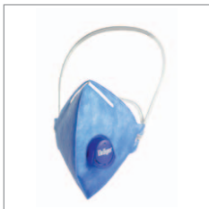
Dräger X-plore 1710 V