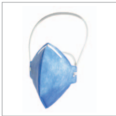
Dräger X-plore 1710