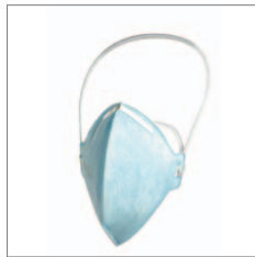
Dräger X-plore 1720