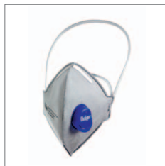
Dräger X-plore 1720 V Odour